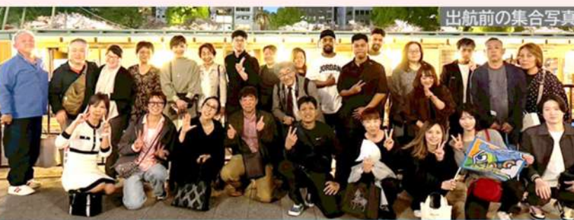
出航前の集合写真