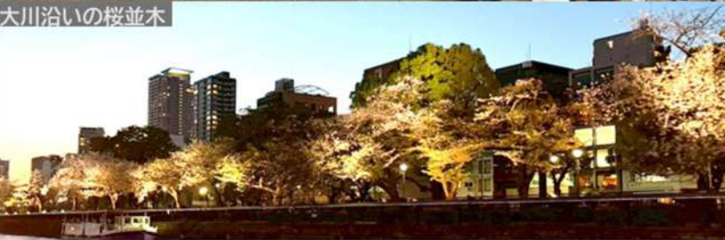
大川沿いの桜並木