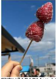
写真は『6FARM』ハウス近くの道の駅で販売しているいちご給です。